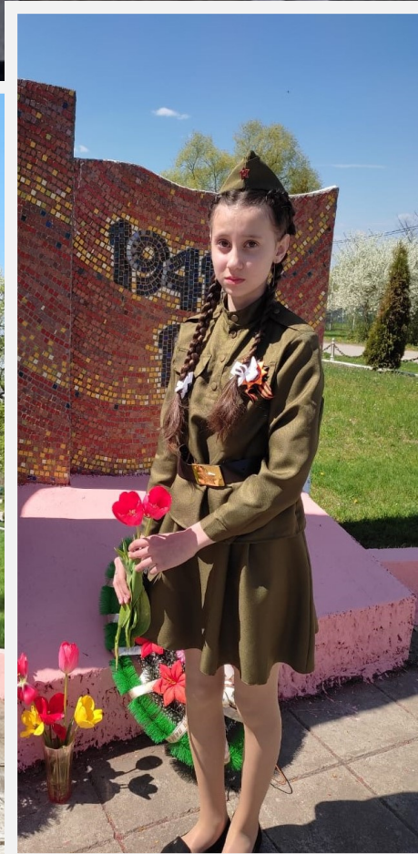
9 мая обучающиеся, педагоги и родители приняли участие в акции «Бессмертный полк».